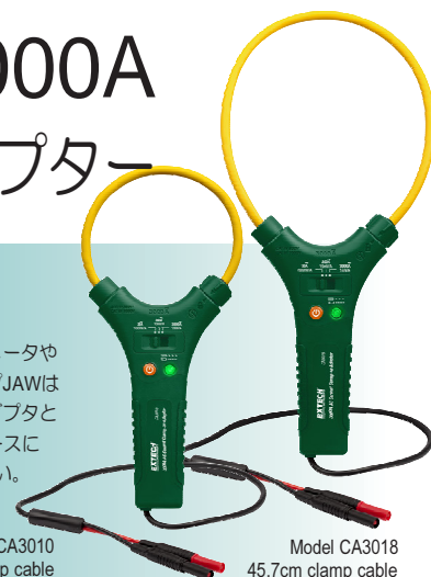
Model CA3010 25.4cm clamp cable

3000A迄のAC電流を測定するマルチメータの機能を拡張します。標準のシュラウド・バナプラグ・ソケットを持ったほとんどのマルチメータやクランプメータに取り付けることができます。フレキシブル・クランプJAWは容易にバスバーとケーブルの束を包み込みます。標準的なクランプ・アダプタとメータでは使用出来ません。薄い7.5mmケーブル径は容易に狭いスペースに収まります。25.4cm、又は、45.7cmクランプ・ケーブル長をお選び下さい。