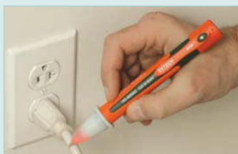
テスト前のライブ線の素早いチェック